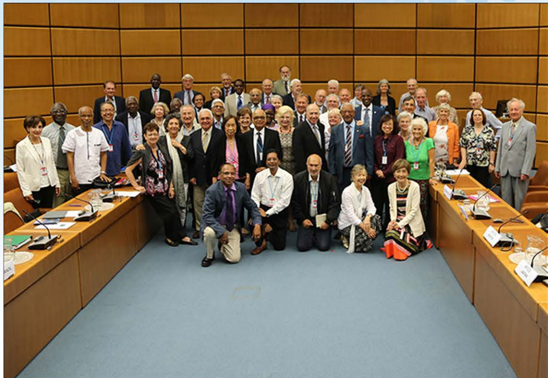
Conseil de la FAAFI, Vienne 2017 FAFICS Council, Vienna 2017